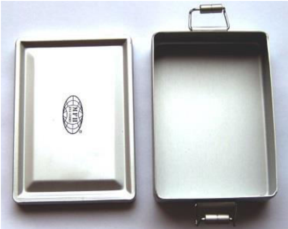
Bild01 : Messschale aus Aluminium mit Deckel